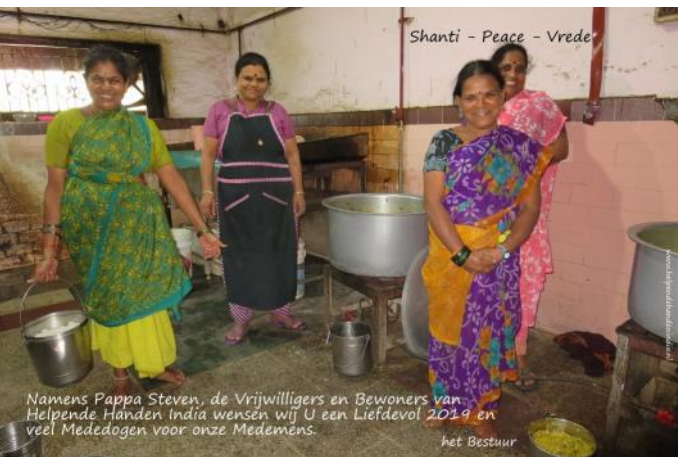
Namens Pappa Steven, de Vrijwilligers en Bewoners van Helpende Handen India wensen wij U een Liefdevol 2019 en veel Mededogen voor onze Medemens. het Bestuur

Wij hopen dat u deze Nieuwsbrief op prijs stelt. Reacties en copy graag naar ons contactadres: bart.veldpaus@gmail.com Voor uitgebreide info: www.helpendehandenindia.nl