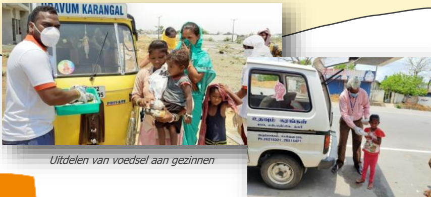
Uitdelen van voedsel aan gezinnen