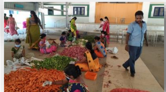
Bewoners, medewerkers en vrijwilligers maken dagelijks vele voedselpakketten

Bovendien dreigt er een nieuwe humanitaire ramp nu delen van India getroffen werden door een cycloon, waardoor veel mensen geëvacueerd moesten worden. Door deze cycloon wordt de toch al kwetsbare gezondheidszorg overvraagd.